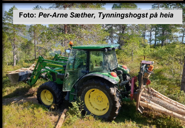
Tynningshogst på heia