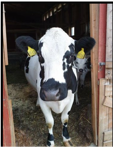
Dronning fjellrose på Mevassetran

Landbruksplanen er en fagplan. Derav følger faglig høring; det vil si at fylkesmannen og lokale landbruksorganisasjoner er høringsinstanser. Arealutvalget er behandlende og innstillende organ. Arealutvalget har også hatt to arbeidsmøter der de har jobbet med planen. Høringen foregikk i perioden 29.04.2020-20.05.2020. Det var innen høringsfristen kommet inn ... uttalelser. Arealutvalget la fram innstilling med forslag til ny landbruksplan i møte den ...2020. Landbruksplanen ble vedtatt i kommunestyret den ...2020.