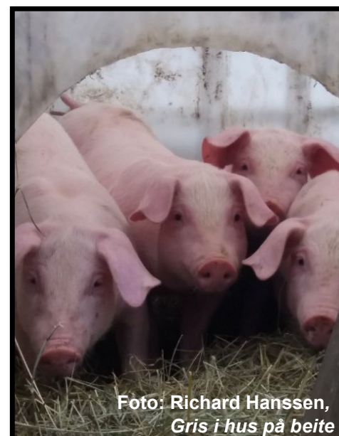
Gris i hus på beite