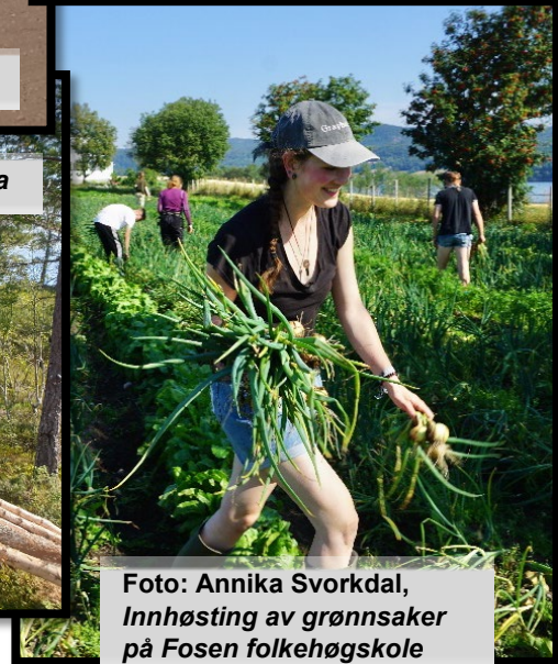
Innhøsting av grønnsaker på Fosen folkehøgskole