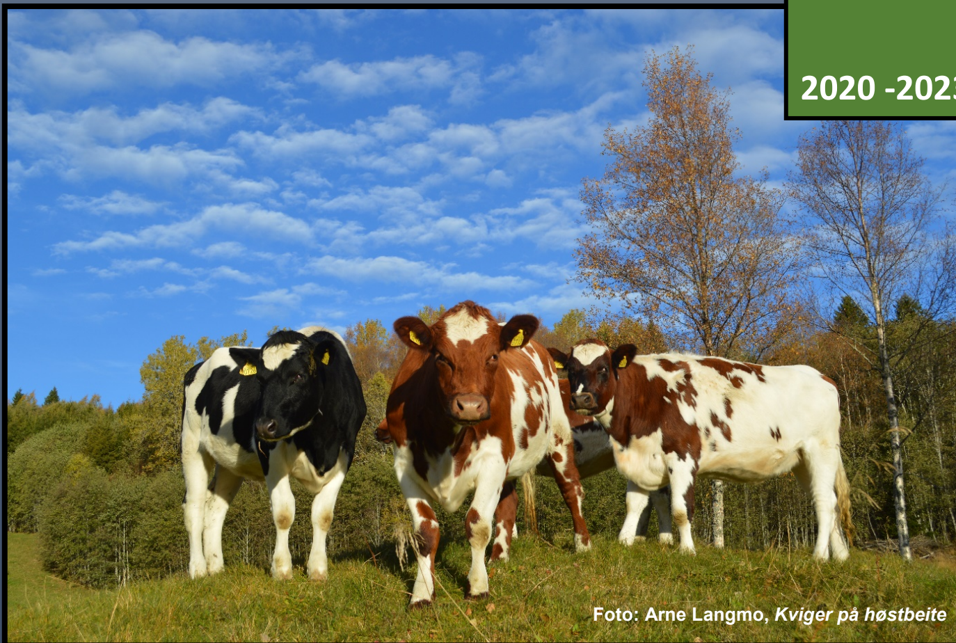
Kviger på høstbeite