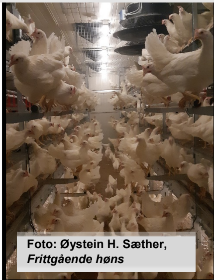
Frittgående høns