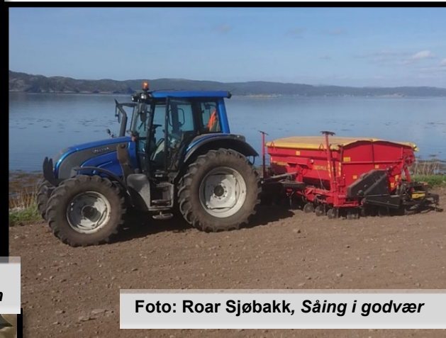
Såing i godvær